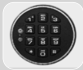
Serrure électronique Horo 410 1 code utilisateur 1 code maître. Temporisation réglable au clavier