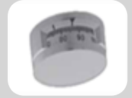
Serrure à disques LG 3330