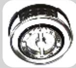
Serrure électronique COMBI 4D 1 code utilisateur 1 code maître. Temporisation réglable au clavier Serrure 3 disques de secours