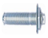
Fixation au sol