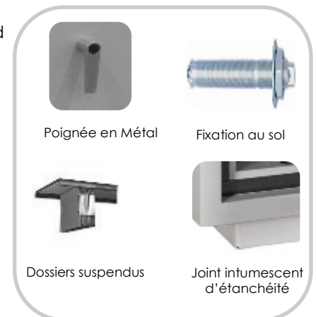
Poignée en Métal