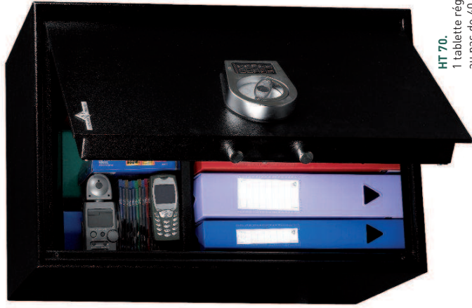
HT 70. 1 tablette réglable en hauteur au pas de 40 mm.

Protection anti-effraction norme européenne EN 14450. Classe S1 (uniquement les modèles avec serrure à clé). Blindage anti-perçage au manganèse du système de condamnation.