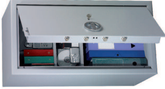
MB 80. 2 tablettes réglables en hauteur au pas de 40 mm.

Protection anti-effraction norme européenne EN 14450. Classe S2 (uniquement les modèles avec serrure à clé). Blindage anti-perçage au manganèse du système de condamnation. Protection anti-feu.