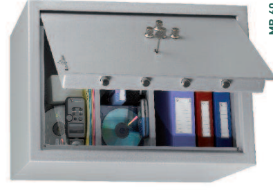
MB 60. 2 tablettes réglables en hauteur au pas de 40 mm.