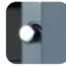
Pêne diamètre 20 mm